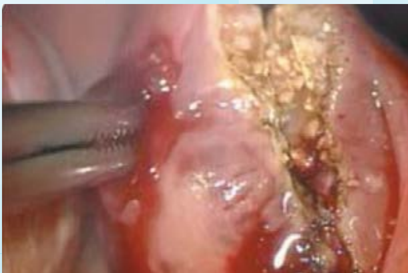
Sitio quirúrgico durante una amigdalectomía con radiofrecuencia