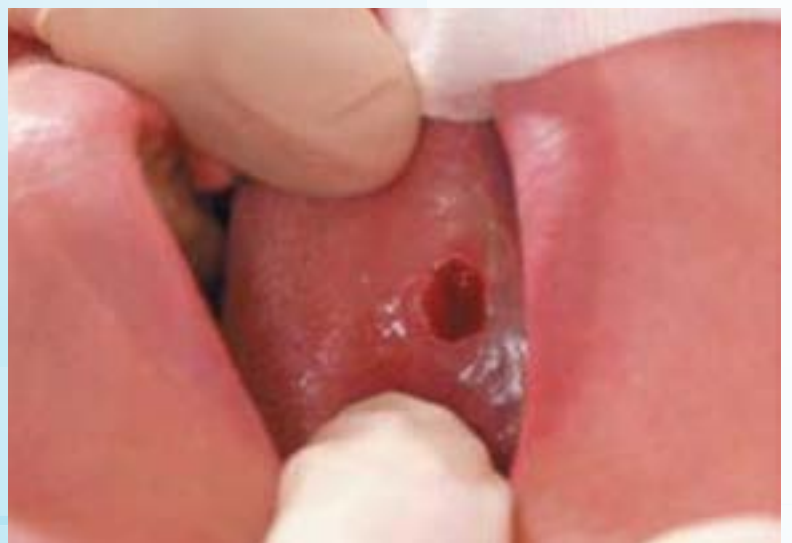
Sitio quirúrgico después de la extracción precisa y total de un papiloma sublingual